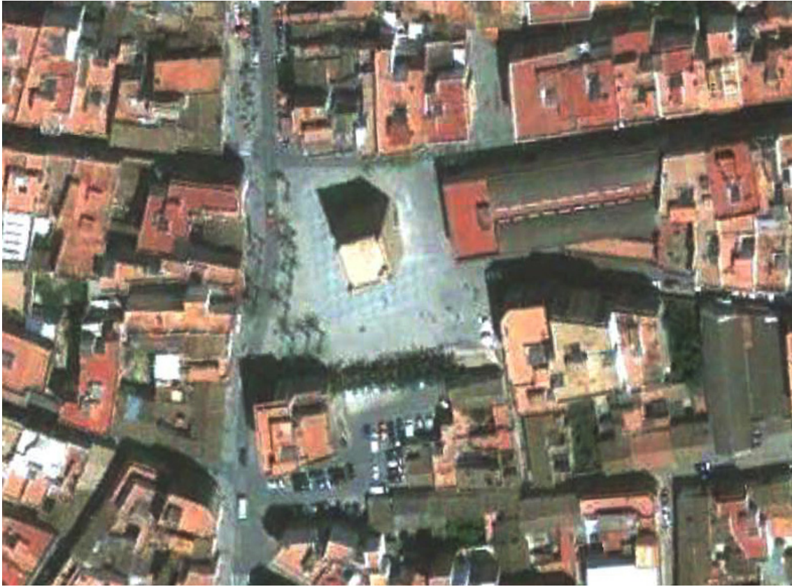
Fotografia aèria del centre històric de Torrent. Imatge de: Google Maps, 21 de maig de 2007.