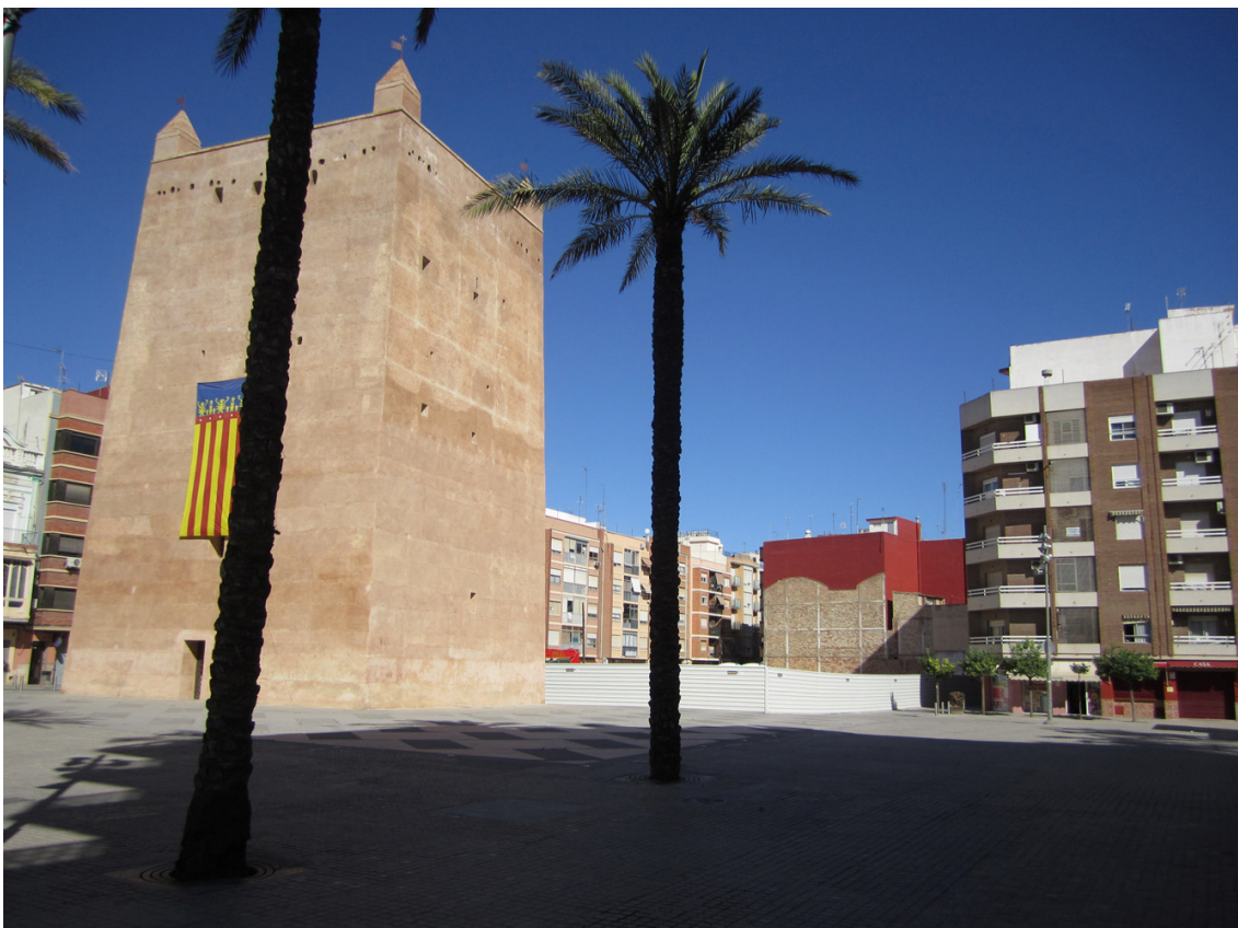
Fotografia actual de l'entorn de la Torre de Torrent on s'observa la desolació i despersonalització del mateix.