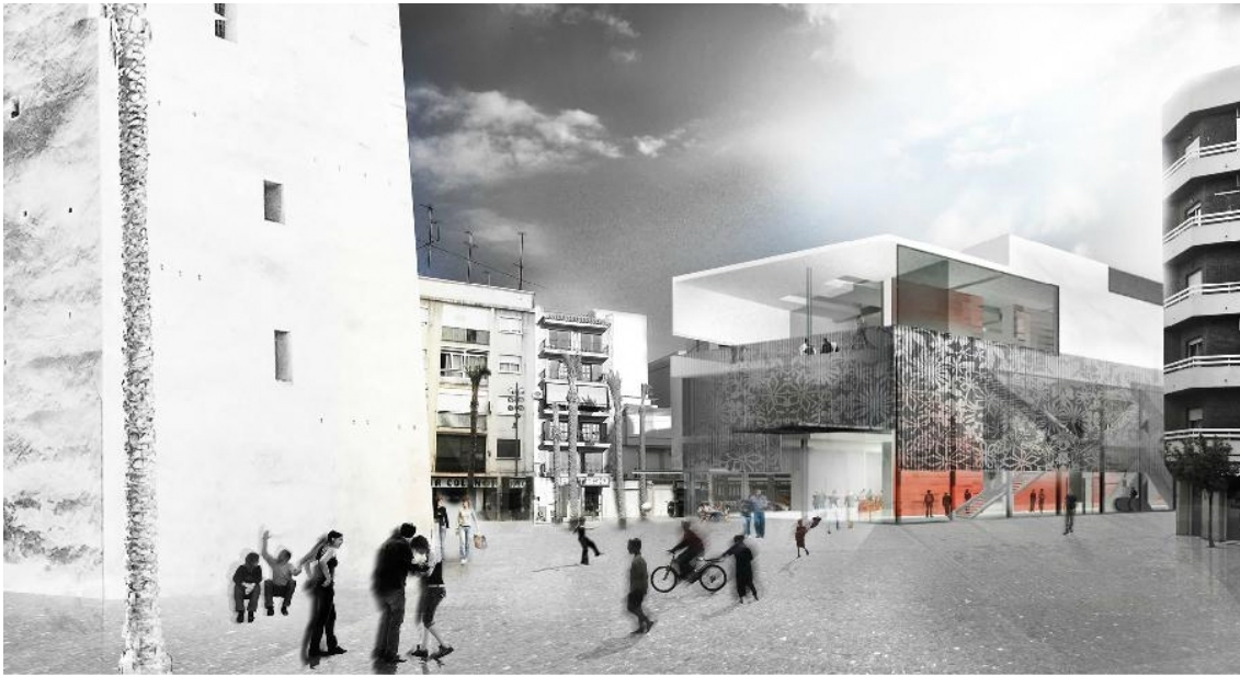
Imatge de la visualització del Projecte del “Mercado Central en Torrent” de l’arquitecte Guillermo Vázquez Consuegra, on s’observa el criteri utilitzar per a la construcció del Nou Mercat, llunyà a les indicacions de la Carta de Washington de 1987.