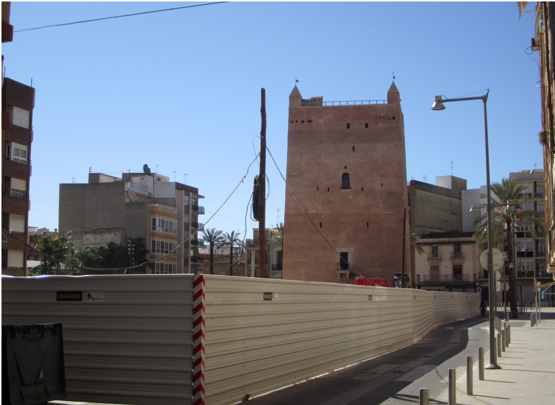
Fotografia actual de l'entorn de la Torre de Torrent on s'observa la desolació i despersonalització del mateix.