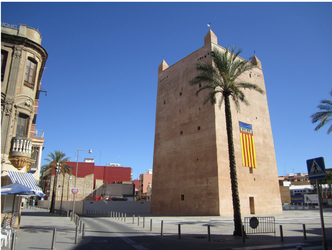
Fotografia actual de l'entorn de la Torre de Torrent on s'observa la desolació i despersonalització del mateix.