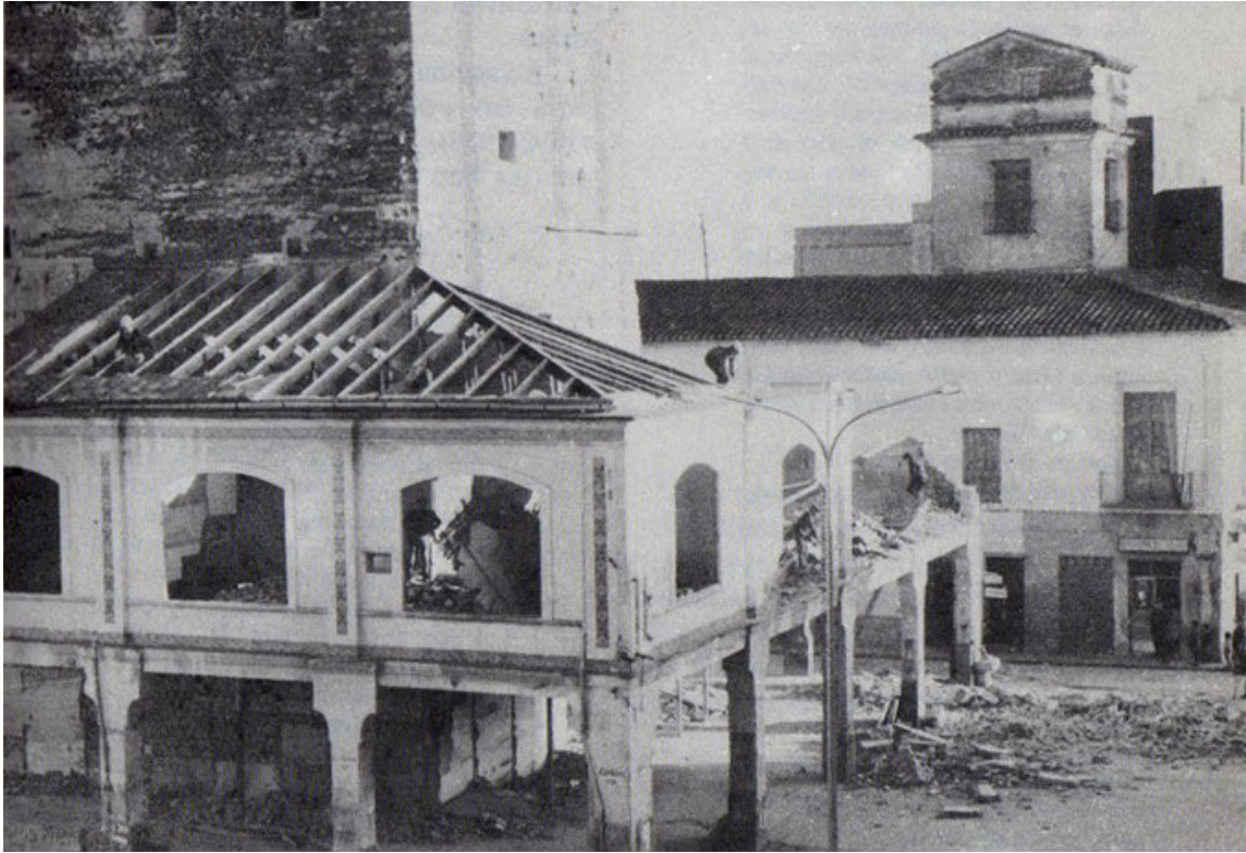
Enderrocament del Porxí que envoltava la Torre de Torrent en gener de 1970.