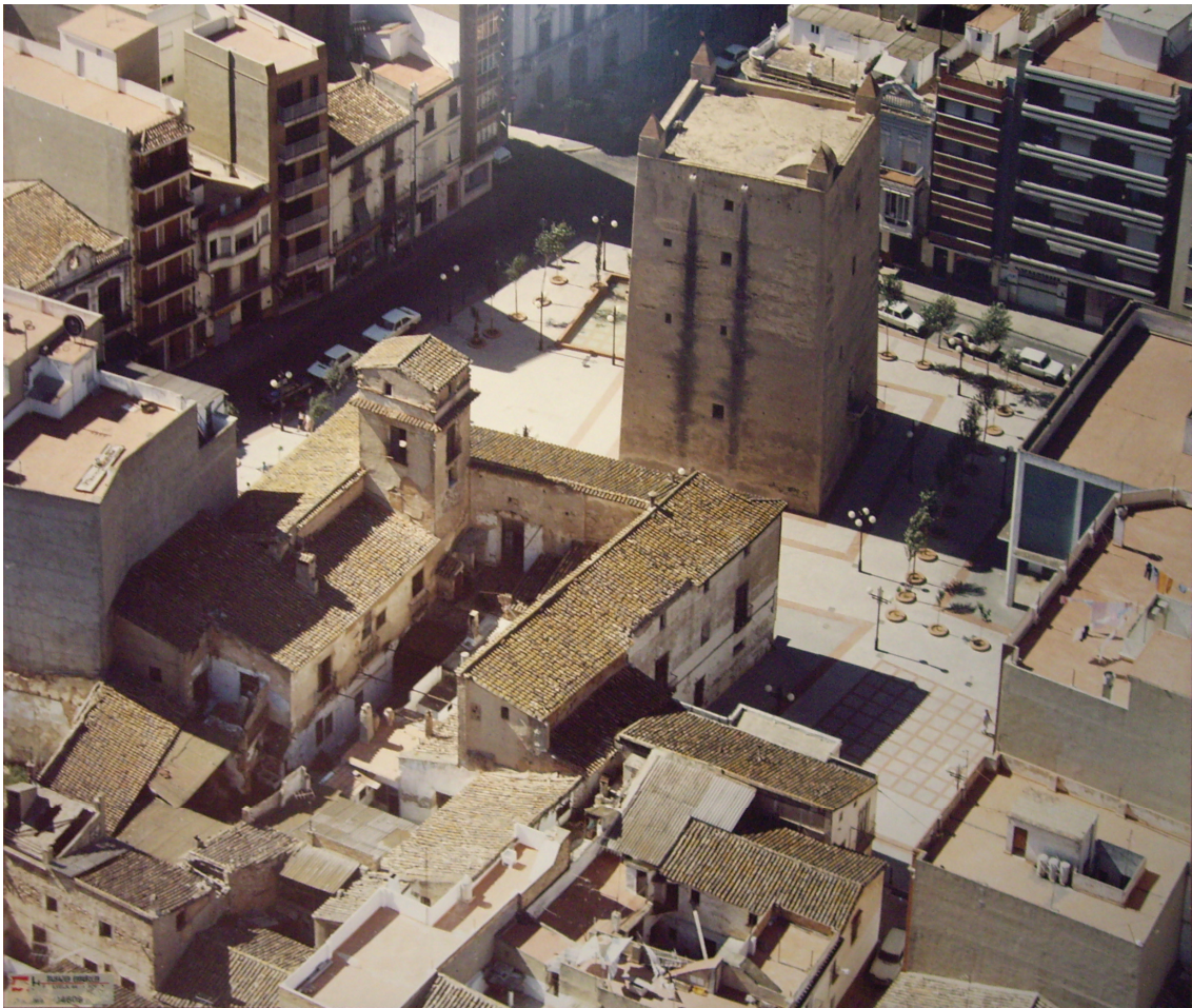
Fotografia aèria de l'entorn de la Torre medieval de Torrent a 1987.