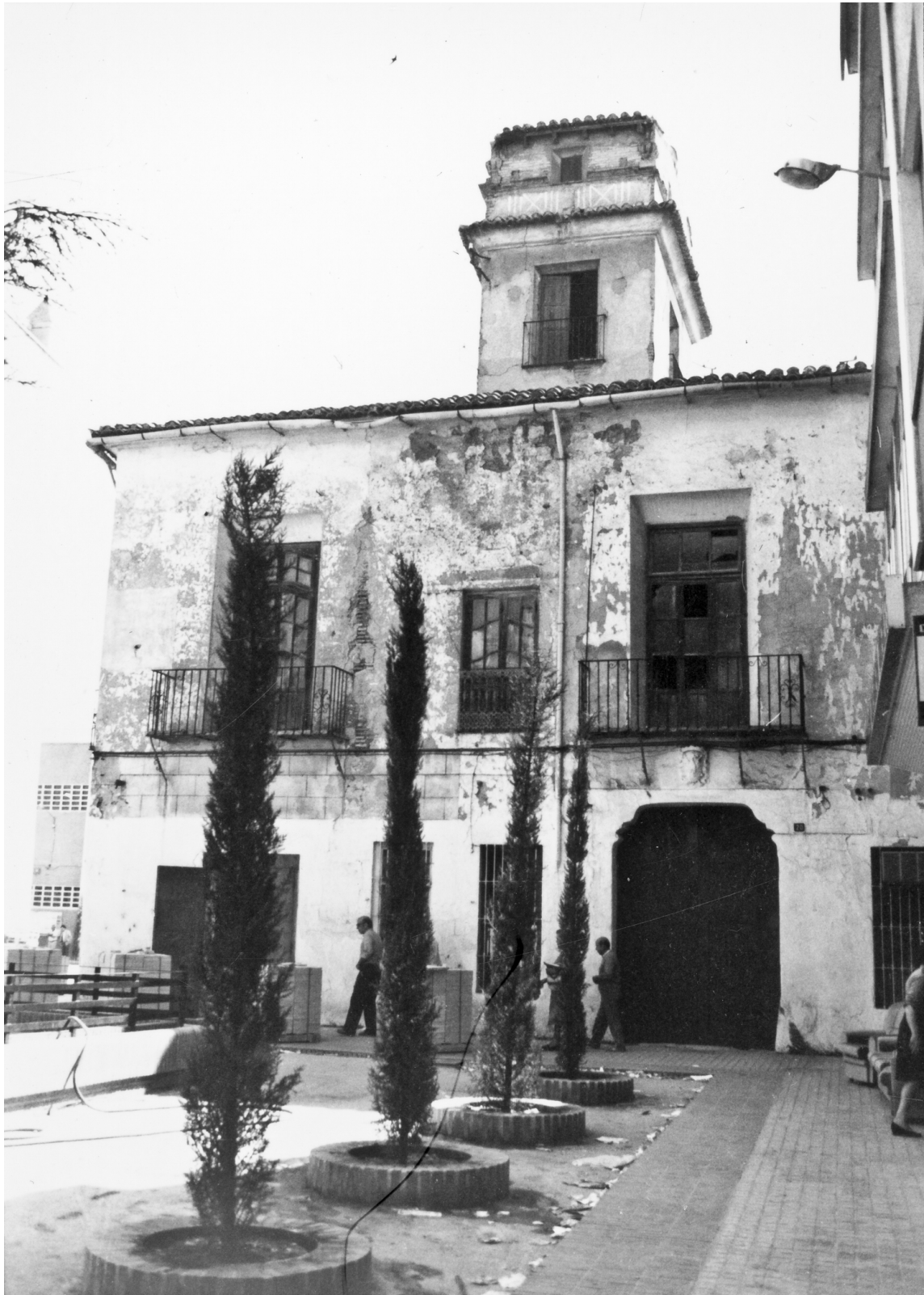
Fotografia de la protegida Casa del Comte Casal a l'entorn de la Torre de Torrent del 13 de maig de 1987, enderrocada l'agost de 1992.