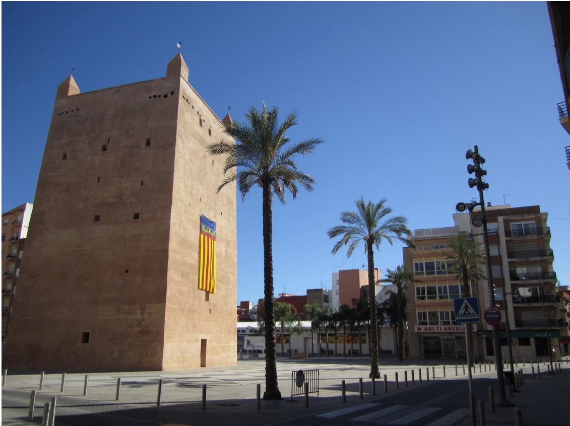
Fotografia actual de l'entorn de la Torre de Torrent on s'observa la desolació i despersonalització del mateix.