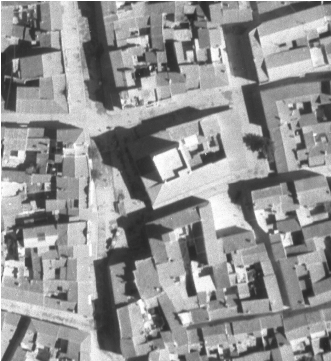
Fotografía aérea de l'entorn de la Torre de Torrent en 1945.