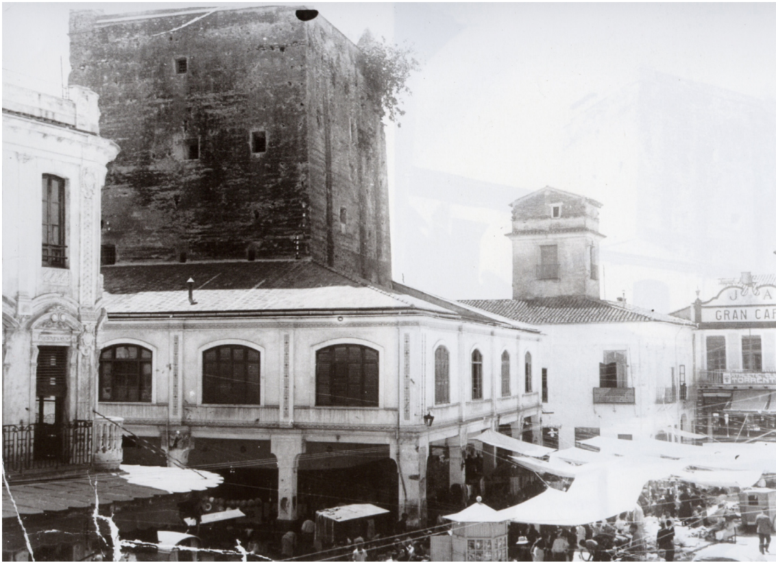
Fotografia del Mercat dels divendres al voltant del Porxí de la Torre.