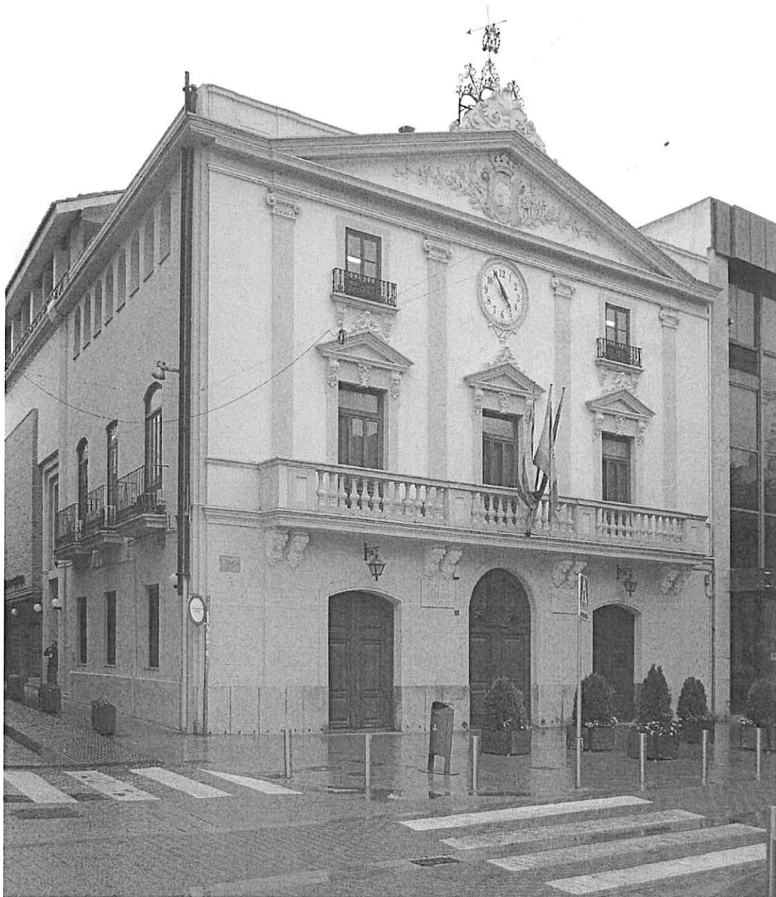
Imatge actual de la façana principal de l'Antic Ajuntament de Torrent, hui Casa de la Cultura, en la qual s'observa, en la part central superior, l'esfera del rellotge i, darrere de la coronació d'aquest alçat, l'estructura que sustenta els tres campanons.