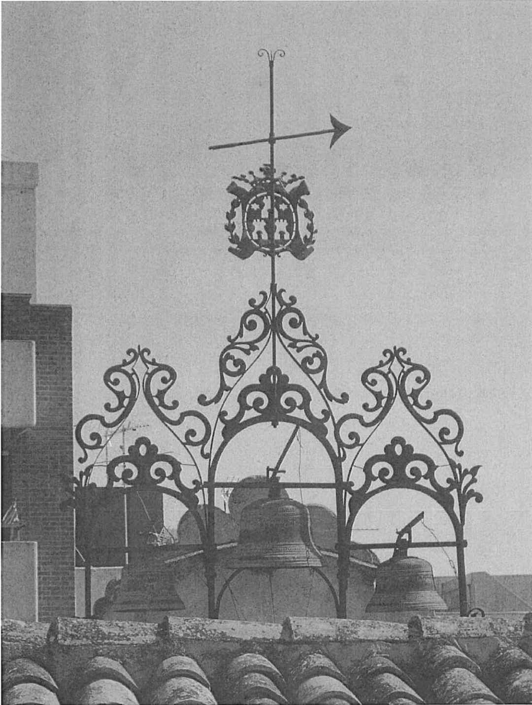
Imatge actual de l'estructura que sustenta els tres campanons ubicats a la coberta de l'Antic Ajuntament, que servien per marcar les hores i els quarts i que formen part del sistema del rellotge públic de Torrent.