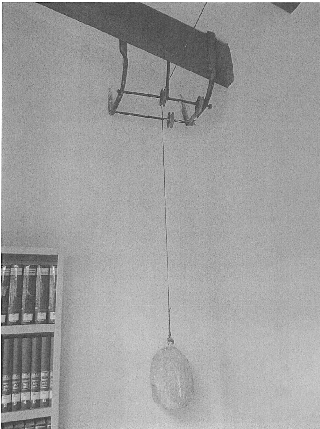
Imatge actual d'un dels contrapesos de pedra ubicat a la sala d'estudi i lectura de la planta segona de l'Antic Ajuntament, actual Casa de la Cultura, que formen part del sistema del rellotge.